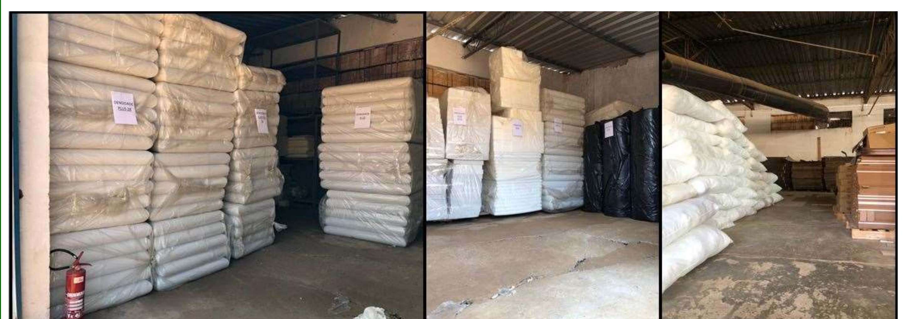
Figura 1 – Almojarifado de espuma e fibra depois

Após elaborar o material de instrução para facilitar o entendimento da ferramenta, foi realizado o treinamento na própria empresa, um processo educacional e de conscientização envolvendo todos os membros da organização visando a mudança de comportamentos e hábitos para proporcionar um aprimoramento de qualidade e condições favoráveis de trabalho.