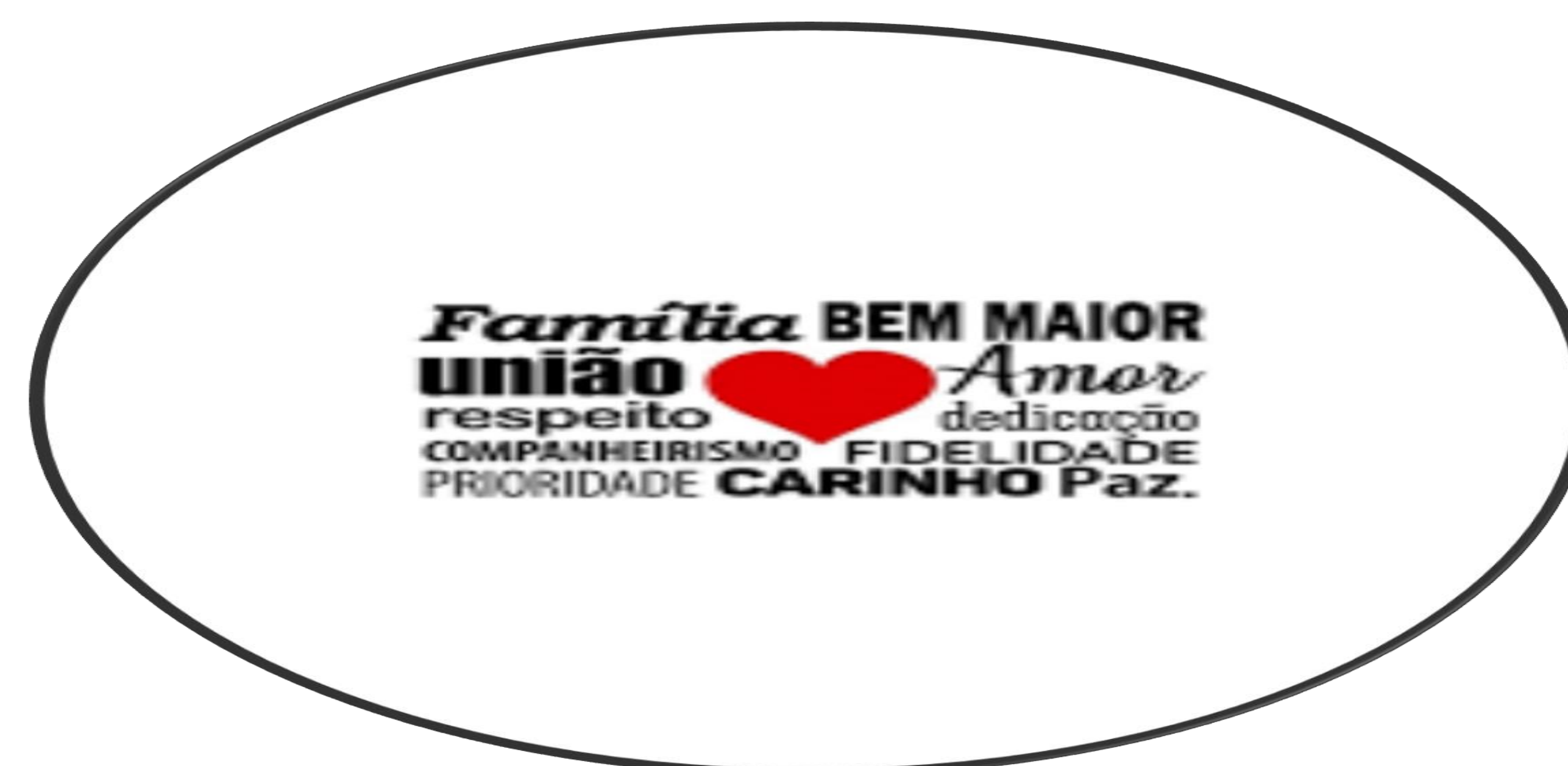
Imagem 02: Expressões relacionadas à família

A 5ª atividade, que encerra o nosso projeto com o tema família, é a criação de um livro com as redações escritas na aula anterior. Esse livro terá participação ativa dos alunos na elaboração de imagens, capa e título e será reproduzido e distribuído como recordação desse momento.