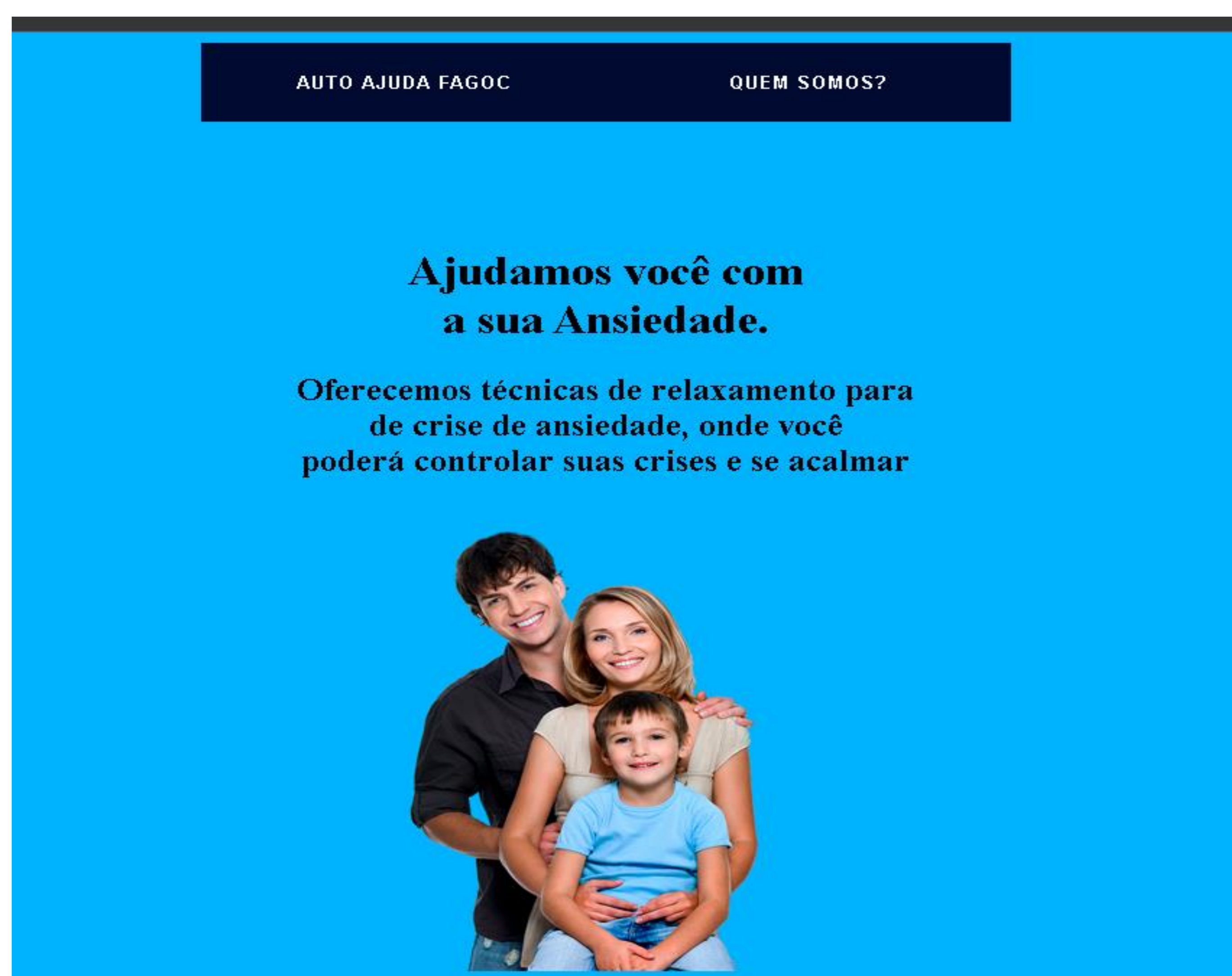
Figura 1 – Tela Principal parte 1

A Figura 2, conta com um texto sobre o porque do projeto e o nome dos membros da equipe.